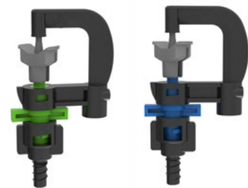
חיבור הברגה מהירה