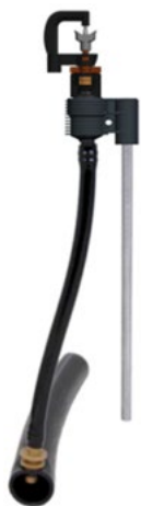
רוטור טווח רחב