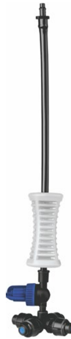
למערכת קירור ליל / רפת MZ104P