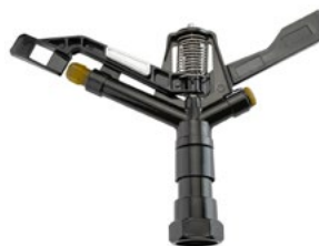
MZ406 עם פילטר