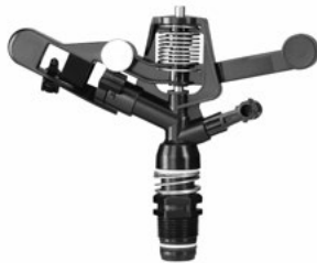
דגם מיוחד עם פיית פיזור (אופציונלי)