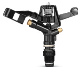
מודל עם פיית פליז