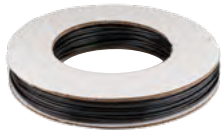
מ"מ 3*5 PVC\PE צינור