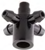
מתאם ארבע יציאות