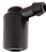
מתאם זיית חד-כיווני