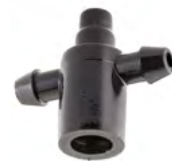
מתאם שתי יציאות