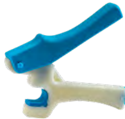
מחורר 2.5 מ"מ